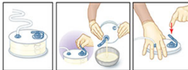
Un drenaje lleno